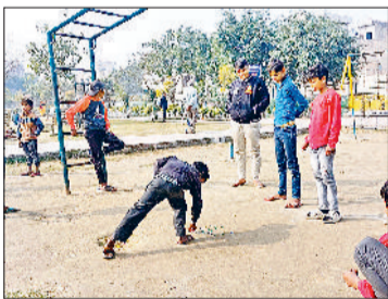
झंझर। धूप निकलने के बाद पार्कों में कंचे खेलते हुए बालक।

सोमवार को एक बार फिर मौसम का मिजाज बदला। करीब दोपहर से सांय तक आसमान में हल्की धूप खिली रही। जिसके कारण पार्कों में खूब रौनक रही। छोटे बच्चों ने जहां पार्कों में झूलों का आनंद लिया। वहीं युवा क्रिकेट, फुटबाल व कंचे खेलते हुए दिखाई दिए। इसके अलावा बुजुर्ग महिलाओं ने पार्कों में भजन गाकर अपना समय व्यतीत किया। उधर, धूप निकलने का असर बाजार के कारोबार पर भी पड़ा। बाजार में लोगों की खासी भीड़ रही और उन्होंने जमकर खरीददारी की। सोमवार को अधिकतम तापमान 21 डिग्री सेल्सियस और न्यूनतम तापमान 11 डिग्री सेल्सियस दर्ज किया