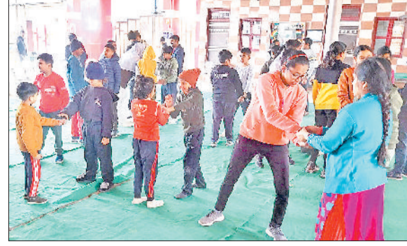
बहादुरगढ़। कैप में प्रशिक्षण प्राप्त करते किशोर।