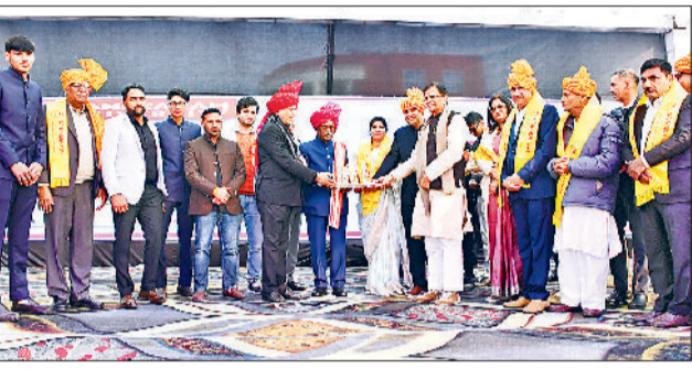
झंझर। संस्कारम विश्वविद्यालय का शुभारंभ करते हुए राज्यपाल बंडारू दत्तात्रेय व कार्यक्रम के दौरान राज्यपाल बंडारू दत्तात्रेय को स्मृति चिन्ह भेंट करते हुए