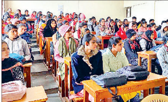
झज्जर। कार्यक्रम के दौरान उपस्थित विद्यार्थी।