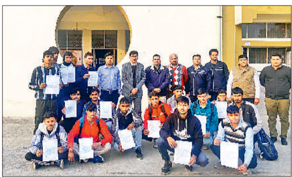
झज्जर। चयनित हुए विद्यार्थी आईटीआई स्टॉफ एवं कंपनी प्रतिनिधियों के साथ।

विद्यार्थियों को सोशल मीडिया का सदुपयोग करके आत्मनिर्भर बनने पर दिया बल