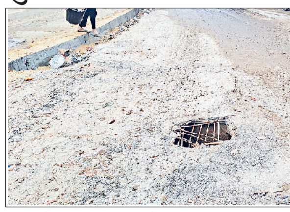
झज्जर। सीताराम गेट क्षेत्र में टूटा हुआ सीवरेज का ढक्कन।

जर्जर हालत सड़क पर भी मेन हॉल का ढक्कन टूटा हुआ है। रात के समय अंधेरा होने पर दुर्घटना होने का डर लगा रहता है। उन्होंने जिला प्रशासन से सड़क निर्माण जल्द करवाए जाने और टूटे हुए मेन हॉल के ढक्कन को बदलवाने की मांग की। इसके अलावा शहर के रहणीया मोहल्ला क्षेत्र में भी सीवरेज का मेन हॉल का ढक्कन खुला पड़ा है। दुर्घटना न हो इसके लिए लोगों ने उसके ऊपर कब्रिया खड़ा हुआ है। लोगों का कहना है कि धुंध के मौसम में यहां दुर्घटना होने का डर सताता रहता है।