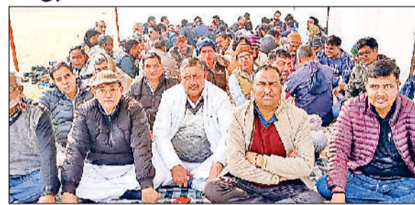
झज्जर। धरने पर बैठे पटवारी एवं कानूनगो एसोसिएशन सदस्य।