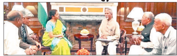
बहादुरगढ़। केंद्रीय वित्त मंत्री से प्रतिनिधिमंडल की घर्वा का फाइल फोटो।

कॉन्फेडरेशन ऑफ एक्स पैरामिलिट्री फोर्सज माटियर्स वेलफेयर एसोसिएशन के पदाधिकारियों ने करीब सवा 4 साले पहले वित्त मंत्री निर्मला सीतारमण से मुलाकात कर सीपीसी कैटीन में उपलब्ध सामान पर लगने वाले जीएसटी में छूट की मांग की थी। अब तक अधूरी पड़ी इस मांग को पूरा करने के लिए एक बार फिर आवाज उठाई गई है। दरअसल, केंद्रीय अर्थसैनिक बलों के जवानों व उनके परिवारों को लिए 26 सितंबर 2006 को सेंट्रल