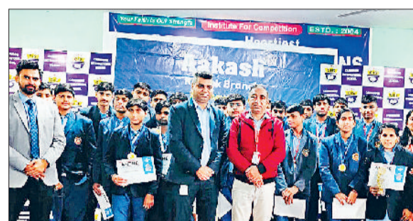
झज्जर। होनहार विद्यार्थियों को सम्मानित करते हुए संस्था पदाधिकारी।

बहादुरगढ़। संतान की दीघार्थु के लिए सोमवार को असंख्य माताओं ने सकट चौथ का व्रत रखा। महिलाओं ने दिनभर निर्जला रहकर शाम को भगवान गणेश का पूजन कर चंद्रमा को अर्घ्य देकर व्रत का समापन किया। बता दें कि माघ माह की चतुर्थी तिथि भगवान श्री गणेश के पूजन के लिए शुभ मानी गई है। सकट चौथ व्रत के दिन स्त्रियां अपने संतान की दीघार्थु एवं सफलता के लिए व्रत रखती हैं। सकट चौथ व्रत के दौरान स्त्रियां पूरे दिन निर्जला व्रत रखती हैं और संध्या के समय भगवान श्री गणेश का पूजन कर चंद्रमा को अर्घ्य देकर जल ग्रहण करती हैं। व्रत के फलस्वरूप विघ्न हरण श्री गणेश तृती स्त्रियों के संतानों को रिद्धि-सिद्धि प्रदान करते हैं।