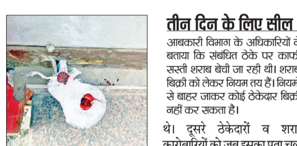
टेके पर लगी पड़ी सील।

आबकारी विभाग ने शांतमई चौक स्थित टेके पर सस्ती शराब बेचने के मामले में कार्रवाई करते हुए सील कर दिया है। कुछ दूसरे टेकेदारों ने ही सस्ती शराब बेचने की शिकायत आबकारी विभाग के अधिकारियों को दी थी। इस पर विभाग ने टेके को तीन दिन के लिए सील कर दिया। विभाग की ओर से टेकेदारों को चेतावनी दी गई कि यदि दोबारा ऐसा किया गया तो सख्त कार्रवाई की जाएगी। बता दें कि शांतमई चौक स्थित शराब के टेके पर कई दिन से सस्ती शराब बेची जा रही थी। उन्होंने टेके पर थारी छूट का बैनर भी लगाया हुआ था। अन्य टेके